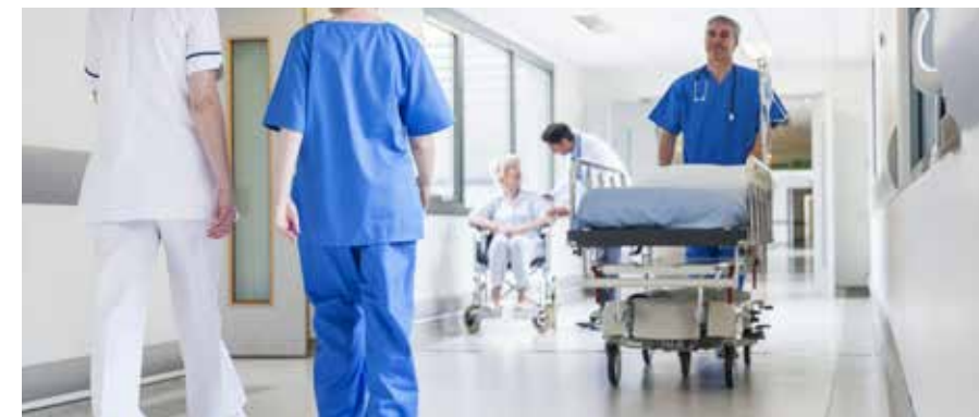
Gänge und Flure

Gerade im Gesundheitsbereich bedarf es einer besonderen Sorgfalt, etwa wenn es um die strikte Einhaltung von Hygienevorschriften geht. Sauberkeit bedeutet aber nicht nur Sicherheit für die Gesundheit Ihrer Patienten, sie vermittelt eine sorgsame Wahrung hoher Qualitätsstandards. „Unsere Hygienemanager beraten Sie gerne.“