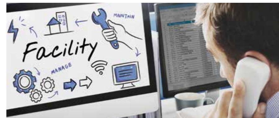
Schmidt Facility Service

Mit Schmidt als Partner haben Sie die Kosten im Griff. Unser System der „offenen Kalkulation“ macht Sie sicher – denn Sie haben jederzeit den genauen Überblick über unsere Leistungen und die exakten Kosten. Gemeinsam mit Ihnen erstellen wir Einsatzpläne, die exakt auf Ihre einzelnen Wohnanlagen und Anforderungen zugeschnitten sind. Jeder Reinigungsplan kann individuell festgelegt werden.