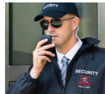
RSD Sicherheitsdienst (Unternehmen der Schmidt Holding)