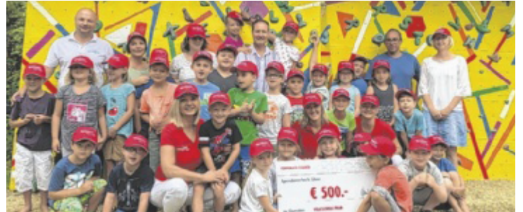
Lehrer und Schüler bedanken sich bei den Sponsoren.

Im kommenden Schuljahr wird die Finanzierung dieser Begleit-