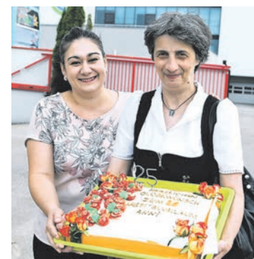
Arbeitskollegen vom KH Ried überraschten Anni zum 25 jährigen Arbeitsjubiläum.