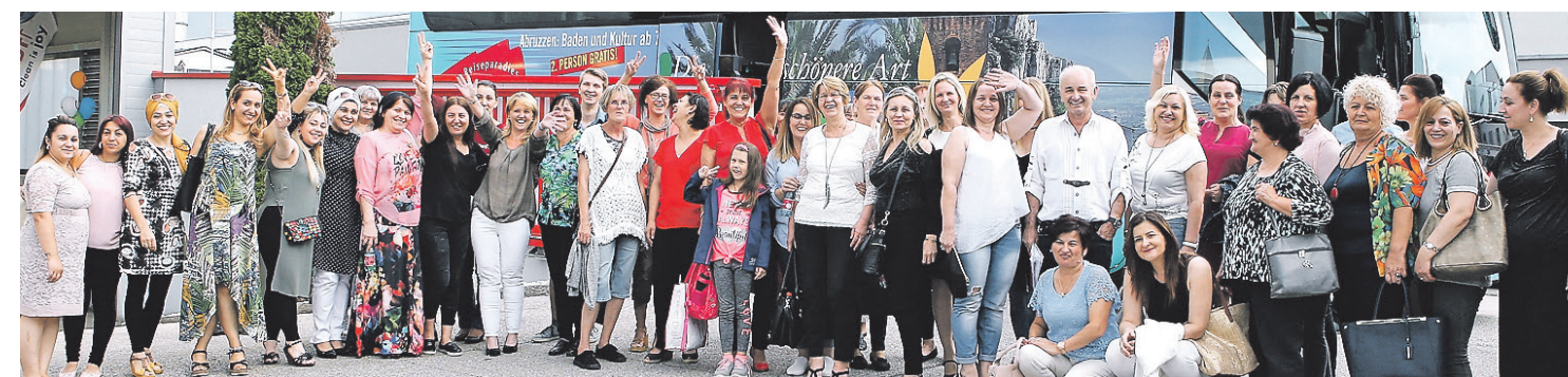
Fröhliche Stimmung bei den Schmidt Mitarbeitern der Niederlassung Linz.