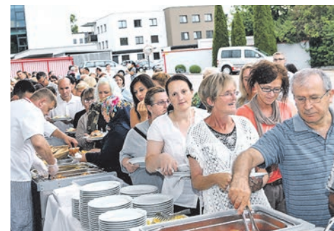
Das Kulinarie vom Krankenhaus Ried sorgte wie immer für Speis und Trank.