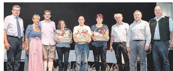
Ehrung von Mitarbeitern aus der Verwaltung, die bereits 15 Jahre lang im Unternehmen sind.