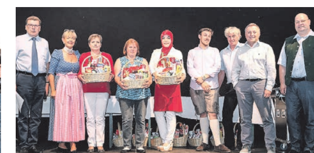
Das Führungsteam bedankte sich bei Reinigungsdamen der Niederlassung Vöcklabruck für 15 Jahre Firmentreue.