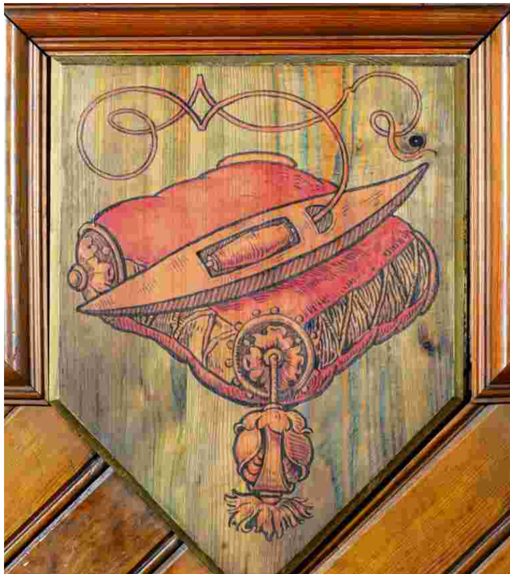
Zunftzeichen der Weber