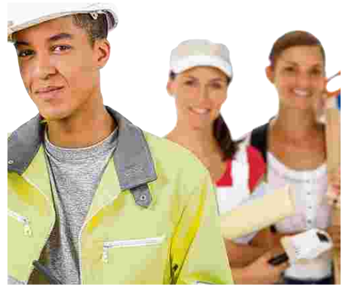
Mehr Beschäftigte, weniger Lehrlinge.

Der Bezirk Ried zeichnet sich durch einen hohen Kaufkraftindex aus – im Jahr 2010 betrug er 93,7. Von den 309,4 Millionen Euro, die im Bezirk Ried im Einzelhandel ausgegeben werden, bleiben 79 Prozent in den Handelsbetrieben vor Ort. Auch die Kaufkraftbilanz des Bezirkes ist positiv. (Quelle WKOÖ/Ried)