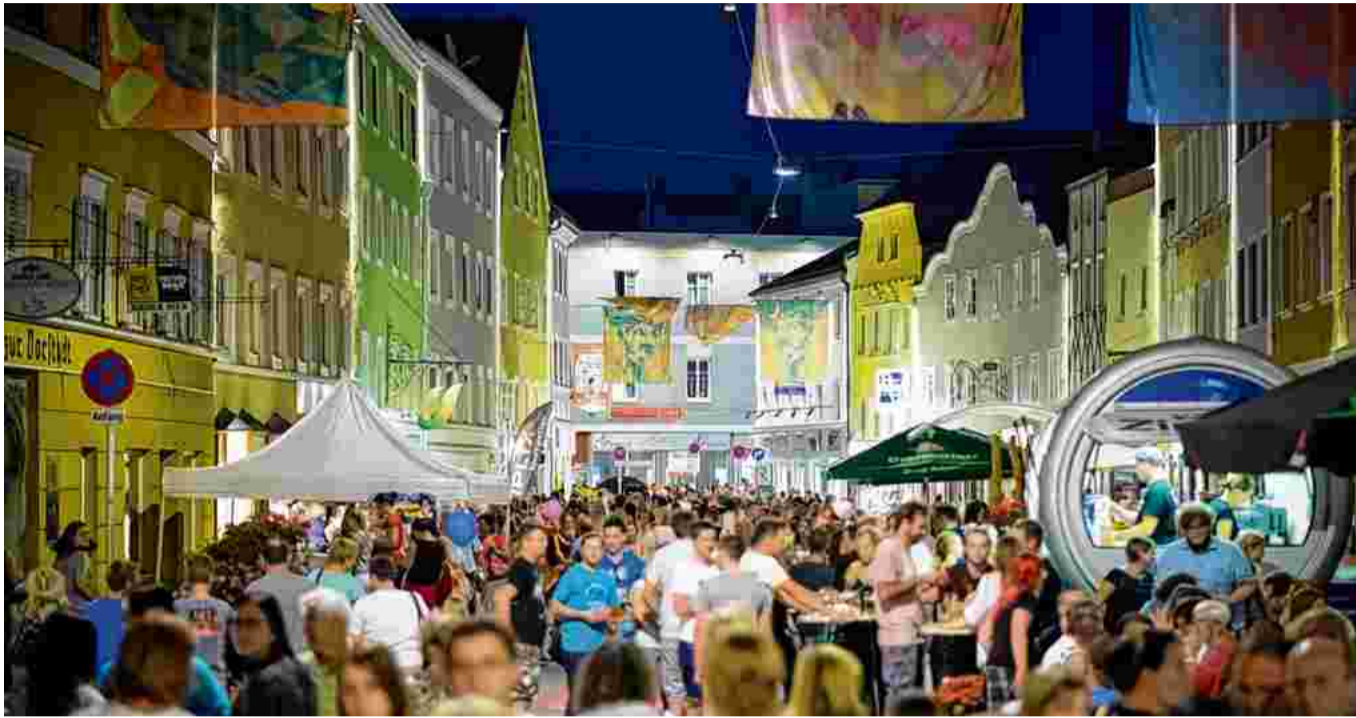
Großartig war die Stimmung beim Eröffnungsfest der neu gestalteten Rieder Innenstadt.

Das Einkaufszentrum wird auch eine gute Klimabilanz aufweisen. So wird das Center unter anderem durch Geothermie-Nutzung jährlich eine CO 2 -Einsparung in der Höhe von bis zu 400 Tonnen im Vergleich