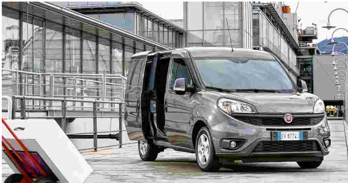
Fiat Doblò Cargo – erfolgreiches Nutzfahrzeug.

Zurückzuführen sind diese Ergebnisse auf vieles, allen voran auf die Einführung des neuen Doblò Cargo zu Beginn des Jahres, der wie der Ducato im Vorjahr die Erfolgsgeschichte weiterschreibt. Ein starkes und flächendeckendes Händler- sowie Service-netz nahm die neuen Modelle in den letzten 18 Monaten sehr gut auf und bildet das wichtige Fundament in diesem hart umkämpften Markt. Die Vielseitigkeit der Modelle und ihrer Varianten (derzeit werden ungefähr 15.000 verschiedene Versionen angeboten) findet hohen Anklang und bietet für jede Anforderung die pas-