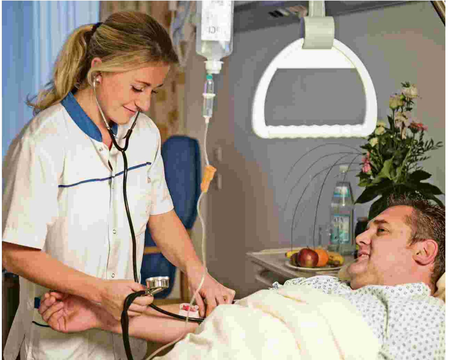
Medizin und Pflege mit Qualität und Seele ist das Ziel, das die Mitarbeitenden des Krankenhauses der Barmherzigen Schwestern Ried haben.