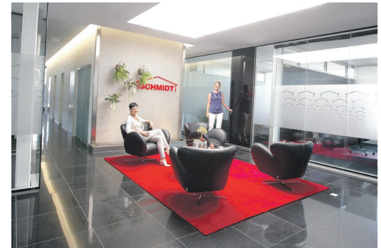
Modernste Ausstattung, klare Strukturen, ein exklusives Interieur und eine einzigartige Architektur spiegeln im gesamten Gebäude Offenheit & Transparenz wider.