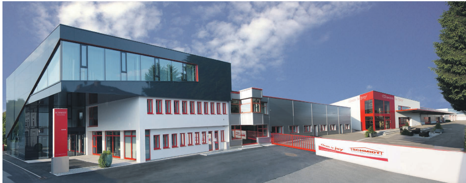
Ein unverwechselbares Gebäude repräsentiert den Geist und Wert der Holdingzentrale von Schmidt.